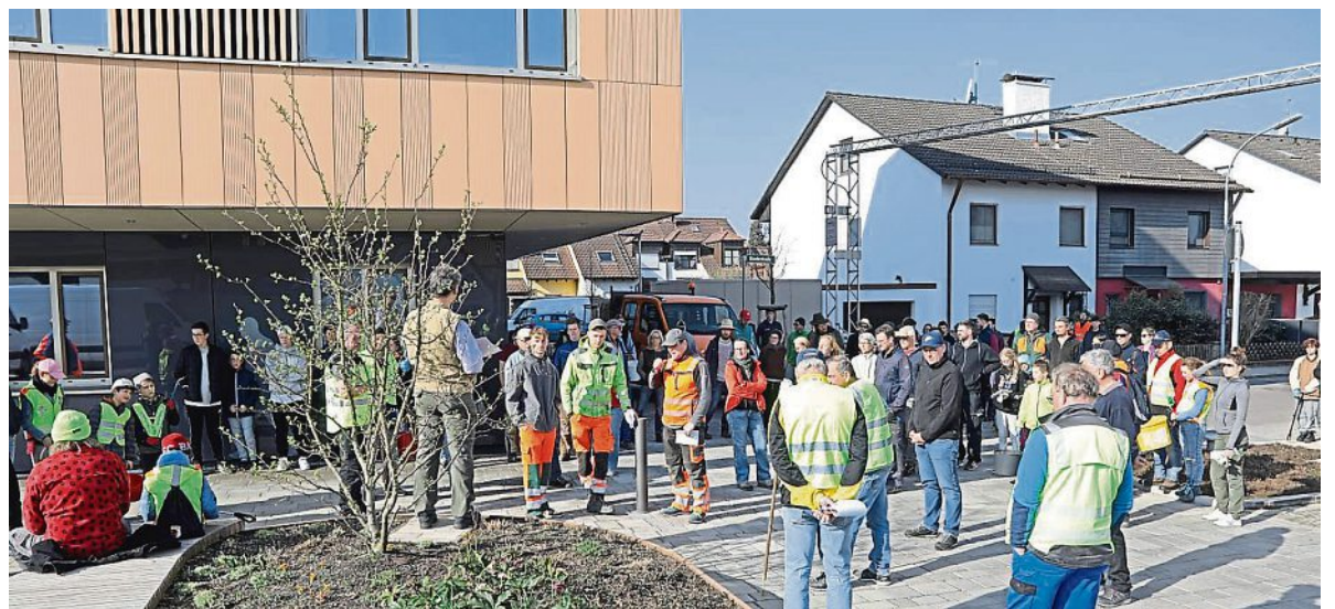
Hohe Resonanz: Viele Helfer kamen, um Müll und Unrat in und um Mammendorf zu sammeln.

Alle Gruppen wurden schnell fündig und karrten eine große Menge Unrat zum gemeindlichen Bauhof, wo der Müll fachgerecht entsorgt wurde. Für das große Engagement dankt die Gemeinde allen Kindern und Jugendlichen aus dem Schulbereich, den beteiligten Vereinen, den Landwirten die Traktoren und Wagen zur Verfügung gestellt haben, den Fahrern und Mitarbeitern vom Bauhof und allen übrigen fleißigen Helferinnen und Helfer.