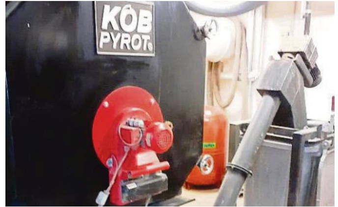
heute noch Service Techniker der ersten Stunde für eine optimale Wartung unserer „alten Dame“.

ar 2005 in Betrieb genommen, wurde von der Firma KÖB & Schäfer aus Österreich der Pyrot Einschubheizkessel mit einer Leistung von 60 bis 220 KW. Nach einigen Jahren wurde die Firma KÖB von der deutschen Firma Viessmann übernommen. Vor etwa zwei Jahren ging die ursprüngliche Firma KÖB wieder zurück nach Österreich an die Firma Mawera. Erfreulich bei dem ganzen Wechsel ist, dass der Service davon unbeschadet geblieben ist. Er war und ist nach wie vor stabil und zuverlässig. Es kommen sogar