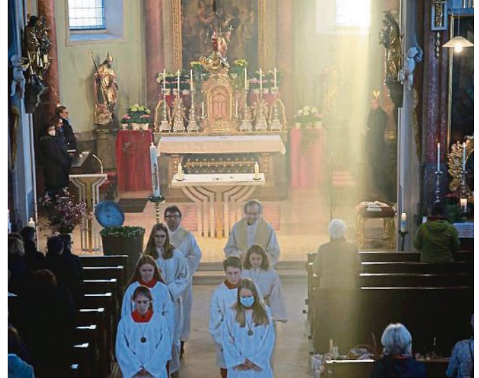
Hochfeste in der Kirche: Heuer konnten nach zwei Jahren entweder entfallener oder sehr restriktiver Gottesdienste die Osterfeierlichkeiten wieder in einem halbwegs normalen Rahmen vorgenommen werden - so wie hier in Mammendorf.

30. April: Pflanzenflohmarkt des OGBV Mammendorf, Schulhof der Dorothea-von-Haldenberg-Schule, Zugang über Parkplatz Schulstraße, 13